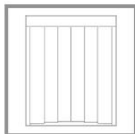
Porte automatiche Automatic sliding doors