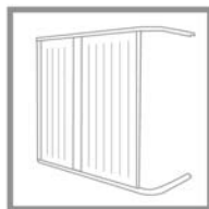
Cancelli flessibili Gates