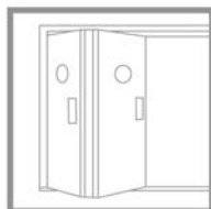
Porte articolate By-folding doors