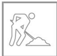
Disponibile a breve Coming soon