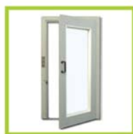
Porte a battente Swing doors